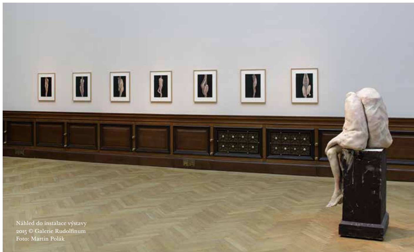
Náhled do instalace výstavy 2015

Marlene Dumas, Tracey Emin, Berlinde De Bruyckere, Kiki Smith a Louise Bourgeois