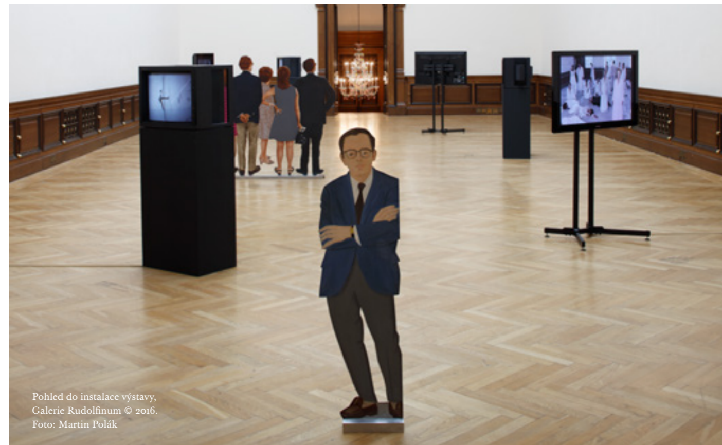
Pohled do instalace výstavy, Galerie Rudolfinum © 2016. Foto: Martin Polák